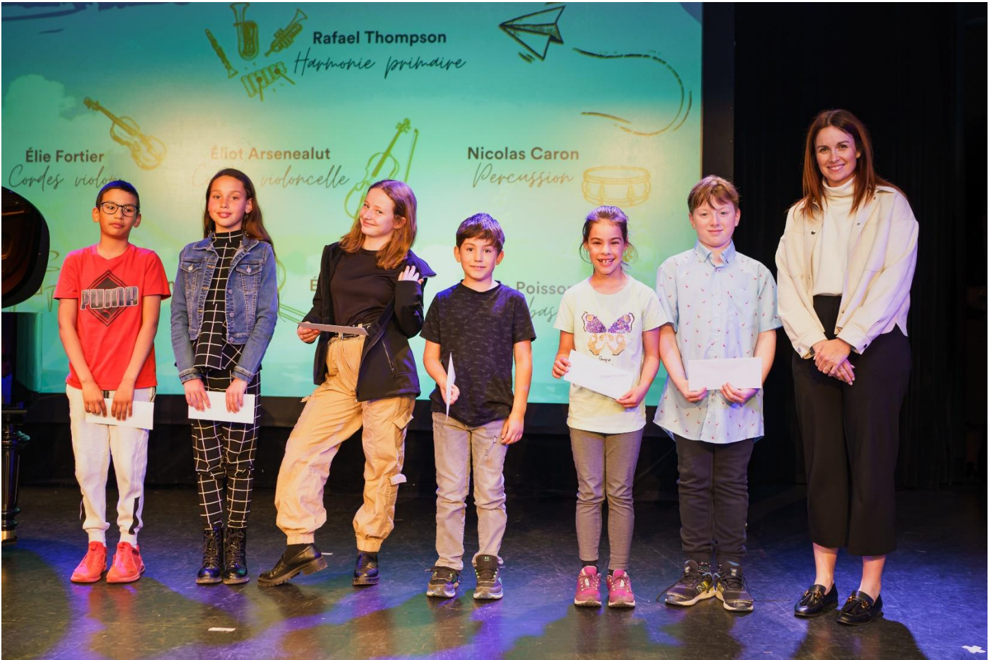
Palmarès du Conservatoire de musique de Val-d'Or