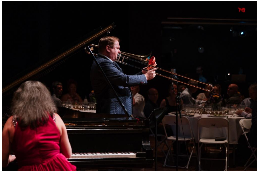
Événement-bénéfice Thème et variations sur Vins et fromages