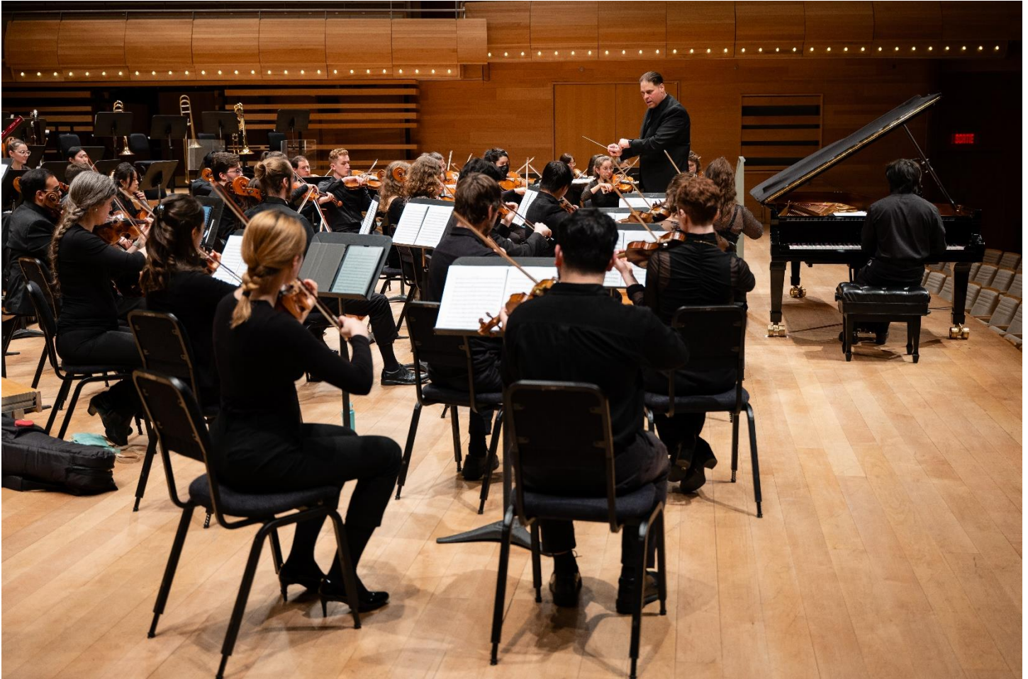
Photo prise lors d'un concert de l'Orchestre symphonique du CMM à la Maison symphonique sous la direction de Jean-Marie Zeitouni.

l'Académie de musique du Québec, les Concours de musique du Canada, les Jeunesses Musicales Canada, la Fédération des harmonies et des orchestres symphoniques du Québec, ainsi que plusieurs écoles publiques, notamment celles dont le projet éducatif privilégie l'éducation artistique, telles l'école secondaire Saint-Luc et l'école secondaire Joseph-François-Perrault du Centre de services scolaires de Montréal.