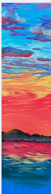
«Les Trois Grâces» - acrylique, Josée Fortin