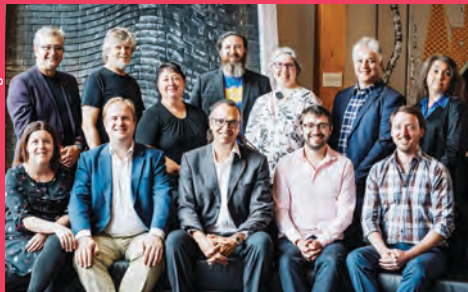
Des membres de l'équipe du Conservatoire