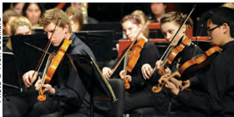
Orchestre des jeunes du Québec Maritime, 2011